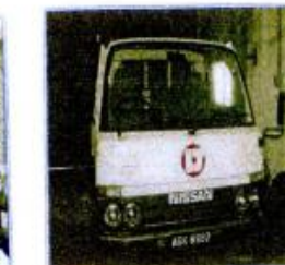
21a) LORI 3 TONNE (NISSAN ADK 902)