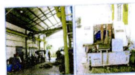
1) OVERHEAD CRANE 2.0 TONNE JENAMA : PEMEX MODEL NO : PMA 69887