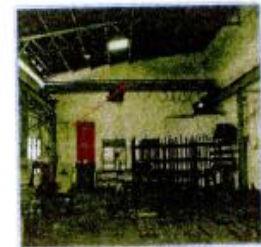
20) OVERHEAD CRANE 2.2 TONNE JENAMA : DEMEC