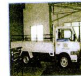
16) LORI 3 TONNEN (NISSAN ADK 90)