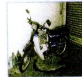
21) MOTOSIKAL (HONDA C 70 ADE 90)