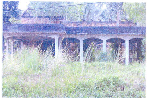
Pandangan dari hadapan