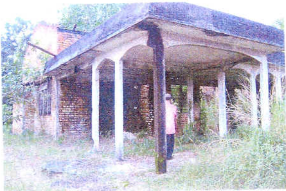
Pandangan dari sisi kiri