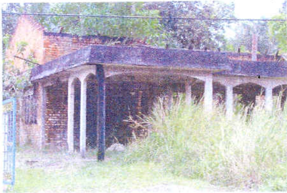
Pandangan dari hadapan