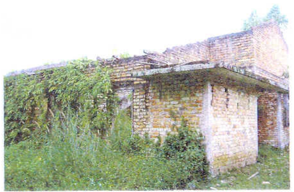
Pandangan dari belakang

Uraian Penilaian (Harta) Ibu Pejabat 13 AUG 2010